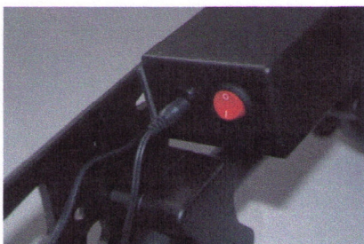
Bild 3 Detail Ladestecker und Ladegerät

Die Beleuchtung des SRK ist mit einer externen, im SRK integrierten Bleibatterie betrieben. Bitte laden Sie die Batterie mit dem mitgelieferten Ladegerät regelmässig (wöchentlich) auf.